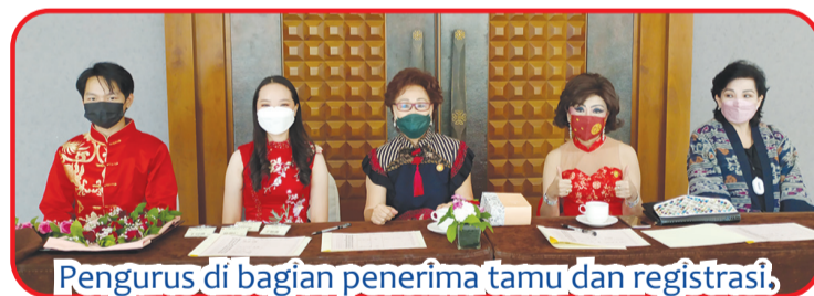
Pengurus di bagian penerima tamu dan registrasi.