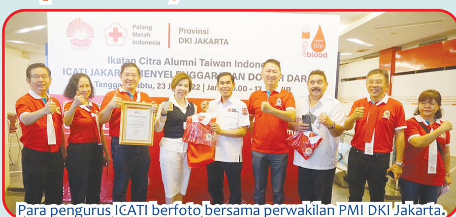
Para pengurus ICATI berfoto bersama perwakilan PMI DKI Jakarta.