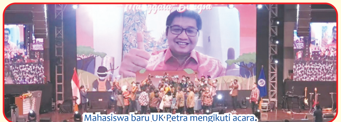
Mahasiswa baru UK Petra mengikuti acara.

SURABAYA (IM) - Sebanyak 1.700 mahasiswa baru UK Petra (Universitas Kristen Petra) mengikuti WGG (Welcome, Grateful Generation!) 2022 yang digelar mulai 25 Juli hingga 2 Agustus 2022 di kampus UK Petra.