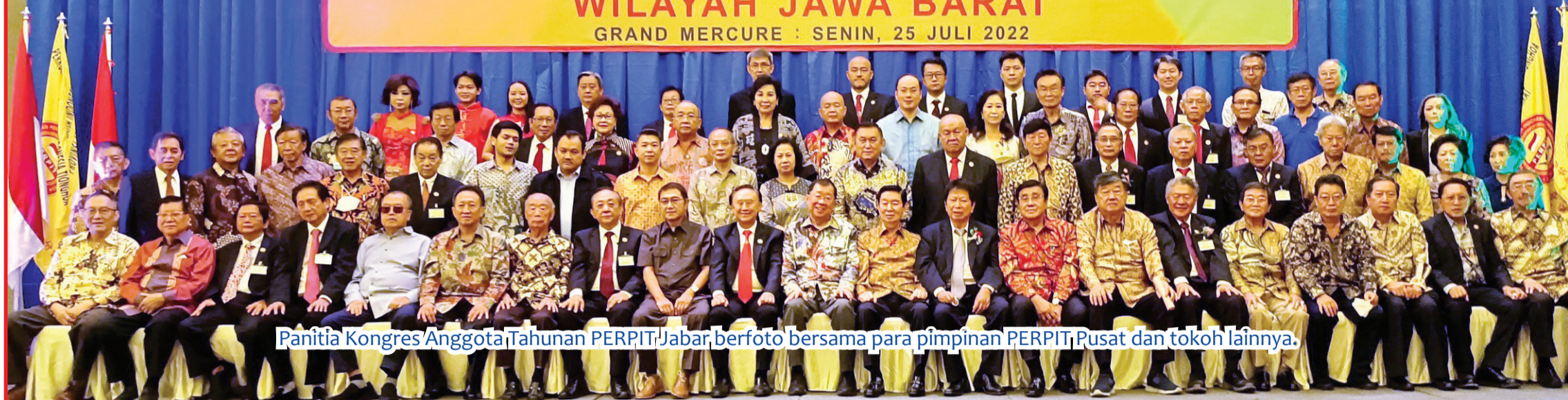
Panitia Kongres Anggota Tahunan PERPIT Jabar berfoto bersama para pimpinan PERPIT Pusat dan tokoh lainnya.