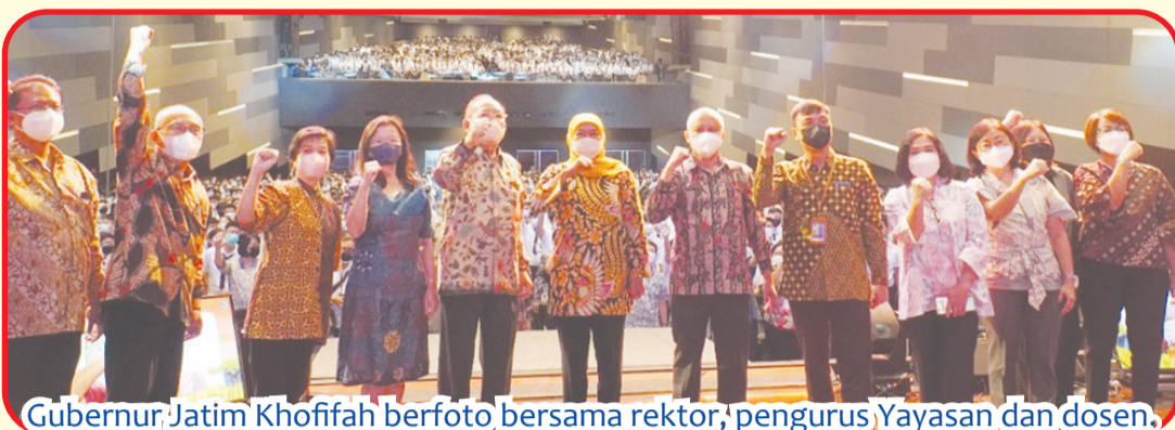
Gubernur Jatim Khofifah berfoto bersama rektor, pengurus Yayasan dan dosen.