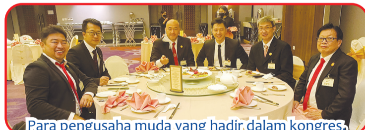
Para pengusaha muda yang hadir dalam kongres.