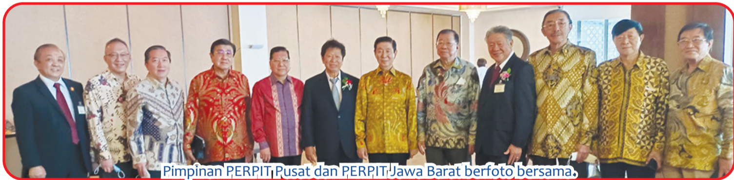
Pimpinan PERPIT Pusat dan PERPIT Jawa Barat berfoto bersama.